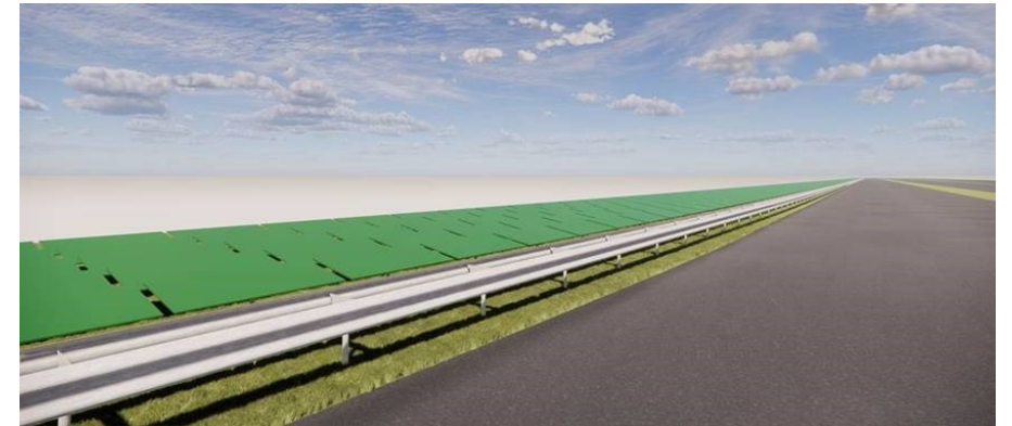
Opstelling maaiveld Parc Sandur